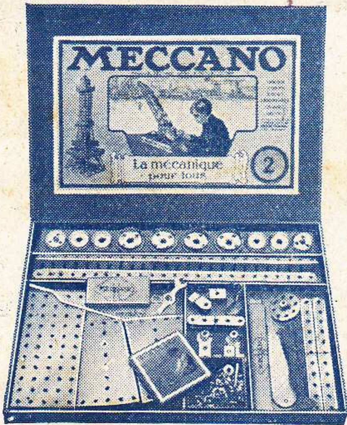
Boîte No 2

Une fois cela fait, prenez chaque modèle séparément et tâchez de le perfectionner. Presque tous les modèles peuvent être construits d'une douzaine de manières différentes.