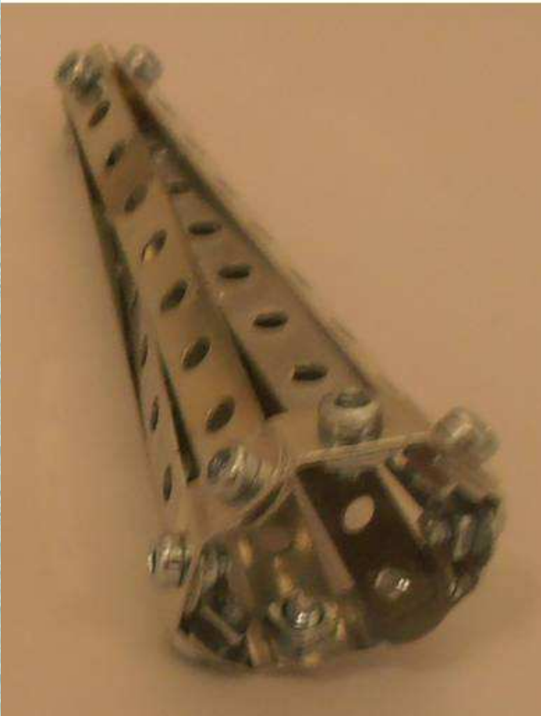
Petit chapiteau du transept 1