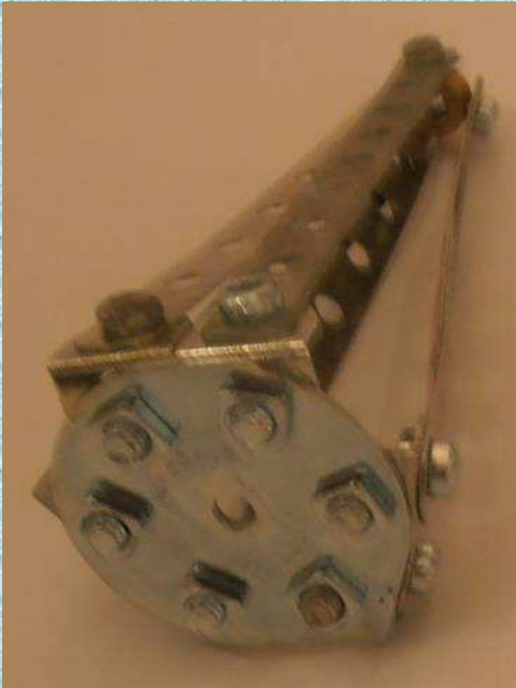
Petit chapiteau du transept 1