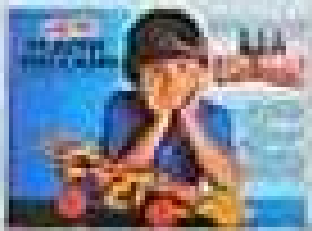
Meccano, pour les grands et les petits !