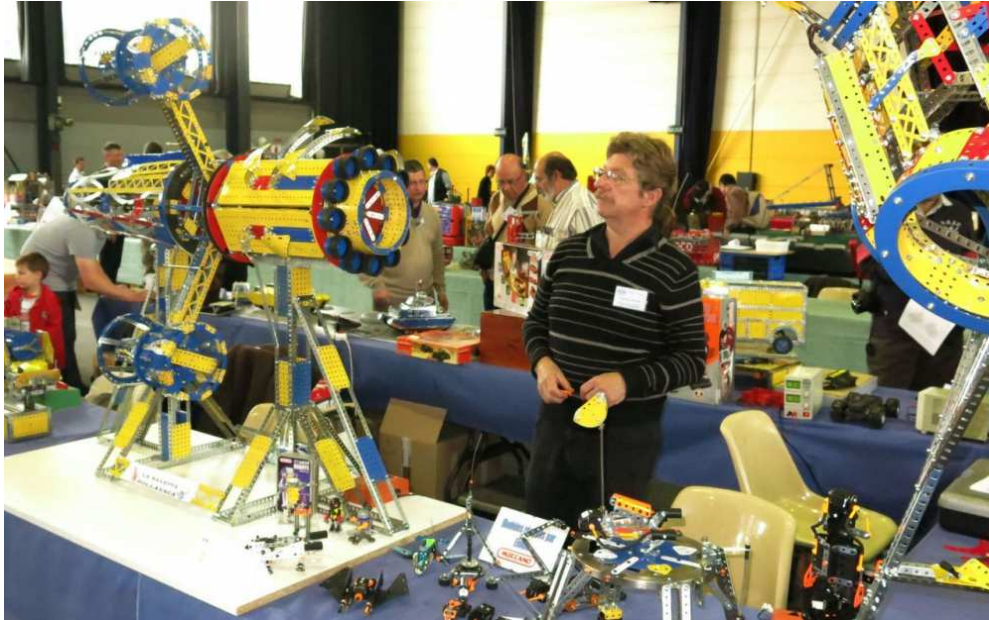
Illustration Le Parisien

Sortir en région parisienne Week-end de l'Ascension Meccano jeu jouet