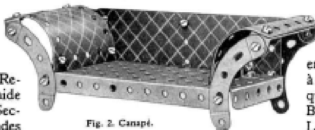
Fig. 2. Canapé.