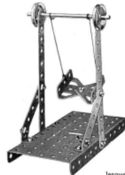
Fig. 3. — Balançoire.

La balançoire représentée sur la figure 3 est un exemple intéressant de ce qu'on peut réaliser avec un très petit nombre de pièces. La construction de ce modèle est si simple que les lecteurs en trouveront tous les détails sur notre cliché. Nous publions ce modèle à titre d'exemple, pour donner une idée du genre de constructions qui peuvent être exécutées par les possesseurs des plus petites Boîtes Meccano. Toutes les pièces qui sont nécessaires au montage de ce modèle et dont nous donnons la liste ci-après, sont contenues dans la Boîte N° 000.