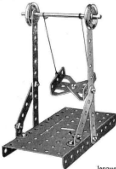
Fig. 3. — Balançoire.

est boulonnée une Plaque à Rebords de 14x6 cm., et à l'autre est fixé, à l'aide d'Equerres, un Moteur à Ressort n° 1.