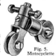
Fig. 5. Motocyclette

Le cadre et la fourche du petit modèle de moto de la figure 5 consistent en deux petites Chapes d'Accouplement jointes par un Boulon de 19 mm. passé dans le moyeu de l'une d'elles et vissé dans l'autre. Une Poulie de 12 mm. est tenue dans chacune de ces Chapes au moyen d'un Boulon de 19 mm. Le guidon est formé de deux Boulons de 9 mm. 1/2.