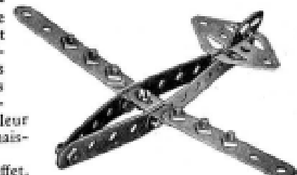
Fig. 4. Hydravion type Dornier.

Tous les modèles que nous avons décrits aujourd'hui sont très simples et leur exécution ne présente aucune difficulté pour nos jeunes ingénieurs Meccano. Il en est même peut-être qui, possédant des collections importantes de pièces Meccano, les trouveront trop simples. A ces derniers, rappelons que chacun de nos modèles peut-être développé et compliqué à l'infini. Pour ceux qui préfèrent construire de grands modèles mécaniques, ces simples exemples peuvent servir de point de départ en leur donnant des idées pour leur permettre de réaliser des modèles de types plus avancés, en faisant intervenir leur imagination, leur ingéniosité et leurs connaissances techniques.