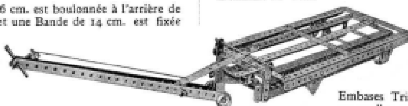
Fig. 7. Chariot.