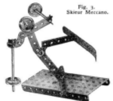
Fig. 3. Skieur Meccano.

La Plate-forme de la superstructure pivotante du modèle est constituée par un Moteur à Ressort. Deux Cornières de 14 cm. sont boulonnées à la paroi supérieure du Moteur, et une Plaque à Rebords de 9 x 6 cm. sert à prolonger la plate-forme. Comme le montre la gravure, une plaque de plomb est fixée au-dessous de la Plaque à