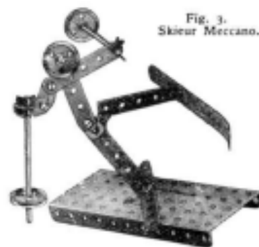
Fig. 3. Skieur Meccano.

La Plate-forme de la superstructure pivotante du modèle est constituée par un Moteur à Ressort. Deux Cornières de 14 cm. sont boulonnées à la paroi supérieure du Moteur, et une Plaque à Rebords de 9 x 6 cm. sert à prolonger la plate-forme. Comme le montre la gravure, une plaque de plomb est fixée au-dessous de la Plaque à