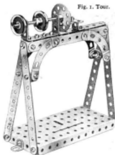
Fig. 1. Tour.

Tour, Meccanographe, Skieur, Excavateur, Arracheuse, Pétrolier.