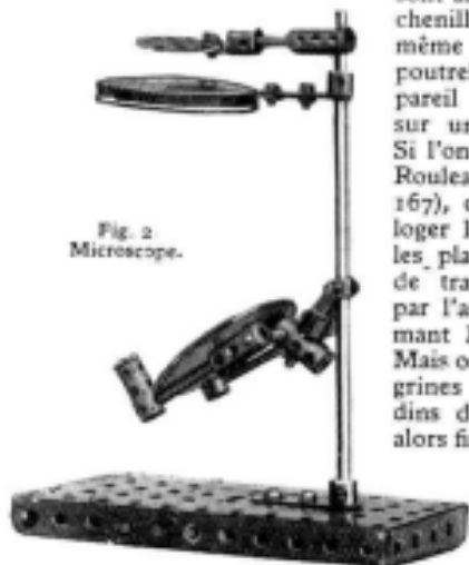
Fig. 2. Microscope.

Deux chenilles seulement sont motrices, et de plus elles sont articulées. Les deux autres chenilles sont articulées de la même manière et fixées à une poutrelle compensatrice. L'appareil peut donc se mouvoir sur un terrain très accidenté. Si l'on emploie le Roulement à Rouleaux Meccano (pièce N° 167), on n'a pas la place pour loger le dispositif central entre les plateaux. On est alors obligé de transmettre le mouvement par l'arbre vertical en supprimant les Roues de 57 dents. Mais on peut remplacer les Longrines Circulaires par deux Boudins de Roue. Le premier sera alors fixé sur le plateau inférieur du roulement au moyen de deux Boulons 6 B.A. dont l'un sert en même temps de borne.