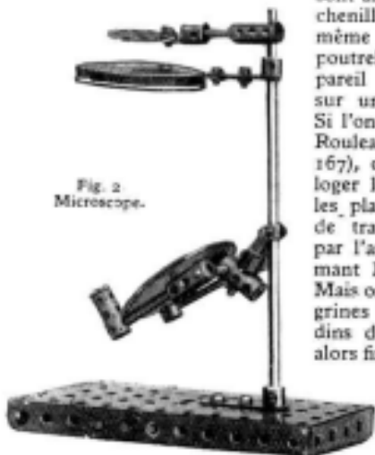
Fig. 2. Microscope.

Deux chenilles seulement sont motrices, et de plus elles sont articulées. Les deux autres chenilles sont articulées de la même manière et fixées à une poutrelle compensatrice. L'appareil peut donc se mouvoir sur un terrain très accidenté. Si l'on emploie le Roulement à Rouleaux Meccano (pièce N° 167), on n'a pas la place pour loger le dispositif central entre les plateaux. On est alors obligé de transmettre le mouvement par l'arbre vertical en supprimant les Roues de 57 dents. Mais on peut remplacer les Longrines Circulaires par deux Boudins de Roue. Le premier sera alors fixé sur le plateau inférieur du roulement au moyen de deux Boulons 6 B.A. dont l'un sert en même temps de borne.