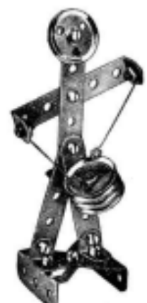
Fig. 3. Tambour.

Deux Equerres Renversées de 12 mm. sont fixées à la Plaque à Rebords de 14 x 6 mm. formant le socle du modèle et servent de supports à deux Tringles verticales de 38 mm. Une Poulie de 7 cm. 1/2 est fixée à l'extrémité de l'une de ces Tringles. La seconde Tringle est munie à son extrémité d'une Roue Barillet, et d'une Poulie fixe de 25 mm. Sur la Roue Barillet on colle un disque