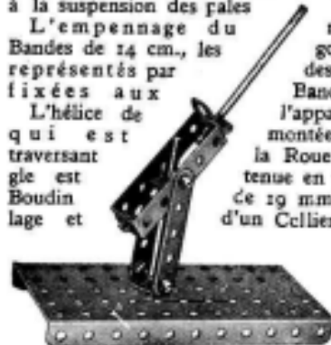
Fig. 2. Canon anti-aérien.