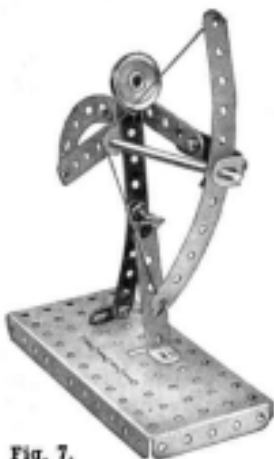
Fig. 7. L'Archer Meccano.

dernière est munie d'un Pignon de 12 % et d'une Roue de Champ de 38 % 1 engrenée avec un Pignon de 12 % fixé sur l'arbre d'entraînement du Moteur.