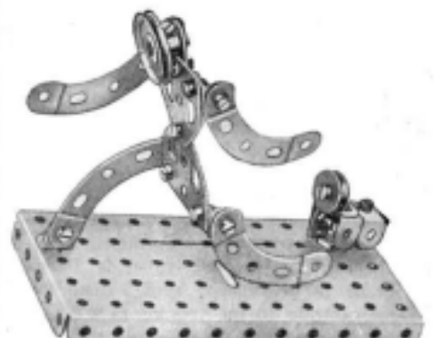
Fig. 8. — L'Homme et le Chien. (Voir suite, page 292).