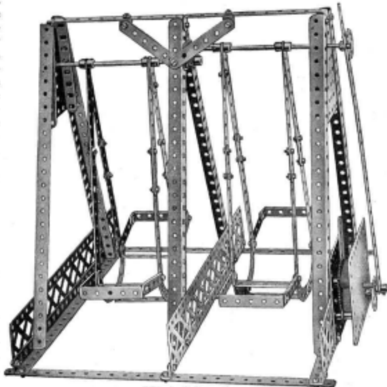
Fig. 4. Balancoire.

la circonférence des Pneus Dunlop montés sur des Poulies de 5 % formant les roues locomotrices. En mettant en rotation rapide la Tringle des Volants, on peut transmettre aux roues locomotrices un mouvement très puissant. Le modèle ainsi lancé, roulera à une belle allure et pourra même monter des pentes escarpées et franchir des obstacles comme, par exemple, de petits livres placés sur son chemin.