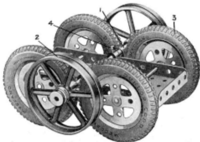
Fig. 2. Truck à Volants.

Ce modèle consiste essentiellement en une Tringle 1 munie à ses extrémités de deux Volants 2 et qui exerce une légère pression sur