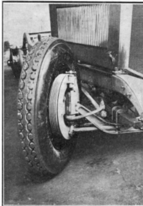
Commande de Freins avant

Voici de quoi pouvoir devenir ingénieur à peu de frais !