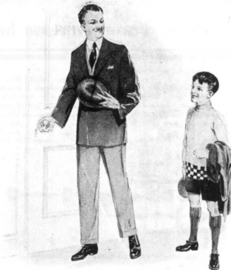
Jean et moi quittâmes à regret le bureau de M. Hornby.

Si seulement les parents pouvaient être amenés à se rendre compte de la valeur des moyens que votre jouet leur fournit pour développer, vivifier, renforcer les facultés de leurs enfants, leur donner l'esprit d'initiative et d'invention, peupler leur cerveau de pensées ardentes, ambitieuses et saines, quelle nation de Surhommes seraient nos futurs travailleurs, dirigeants et ouvriers!