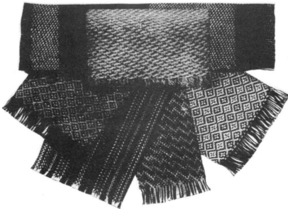
Cette gravure représente plusieurs spécimens des beaux tissus qu'on peut confectionner avec le Métier à Tisser Meccano. Malheureusement il nous est impossible de les reproduire en couleurs, de sorte que la gravure ne donne qu'une pauvre idée de la diversité des tissus et de leur coloris.

en faisant ce geste, me demandais si la machine allait être aussi obéissante à mon invite qu'elle l'avait été à celle de Monsieur Hornby. Je commençai à tourner et éprouvai un frisson d'attente tel que j'en n'en avais jamais senti depuis bien des années. Et voici que la machine se remit à vivre; toutes ses pièces, jusqu'à la plus minuscule, semblaient avoir conscience de ce qu'elles avaient à faire et de l'instant précis où le faire. Le zéaialement de la navette me médusait, elle dardait de droite à gauche, de gauche à droite, entre les fils de la trame, laissant derrière elle une petite ligne bleue de trame que le râtelet venait aussitôt comprimer en étoffe finie.