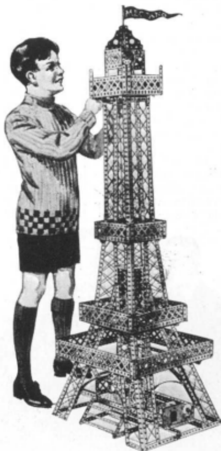
Jean examine la Tour Eiffel

Le système Meccano est en effet rigoureusement conforme aux lois de l'art de l'ingénieur et aux principes de la mécanique jusqu'à ce que ces lois et ces principes soient abolis, rien ne pourra le remplacer. Croyez-m'en : tout autre jouet instructif visant au même résultat par d'autres moyens est fatalement antiscientifique, et de nature, par conséquent, à faire aux jeunes gens plus de mal que de bien, puisqu'il leur met en tête des idées fausses au lieu de connaissances utiles.