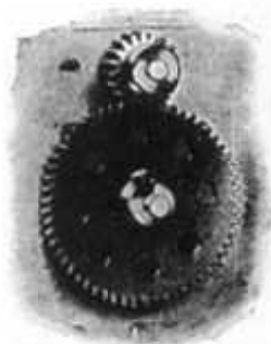
M. S. 2