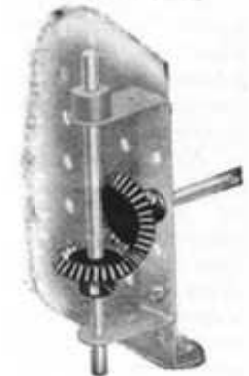
M. S. 4

Engrenages coniques (pour arbres placés à angle droit.)