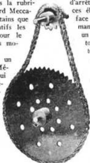
M. S. 7 - Engrenage à chaîne