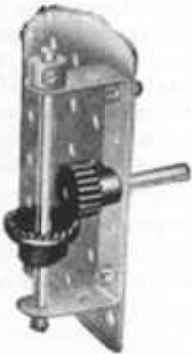
M.S.3 - Engrenage à roue de champ (pour arbres placés à angle droit)