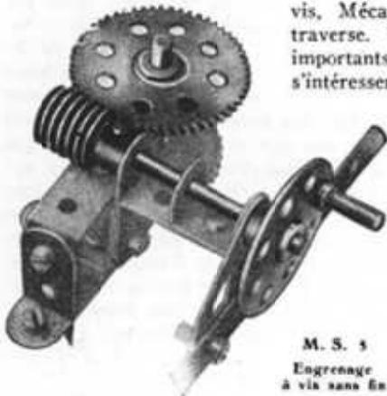
M. S. 5 Engrenage à vis sans fin