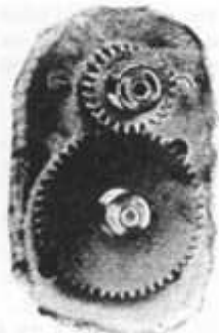
M. S. 1.

Le mécanisme Standard N° 1 représente le pignon Meccano de 19 m/m, engré-