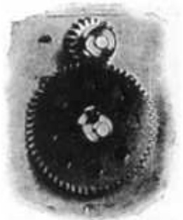
M. S. 2