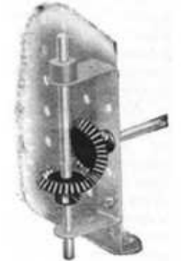
M. S. 4

Engrenages coniques (pour arbres placés à angle droit.)