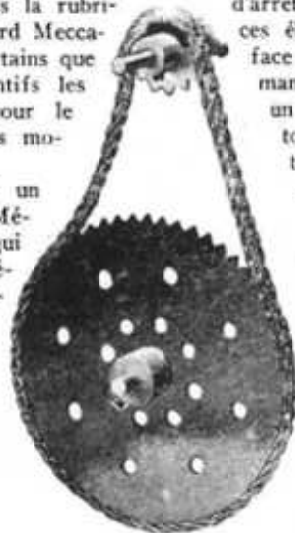
M. S. 7 - Engrenage à chaîne