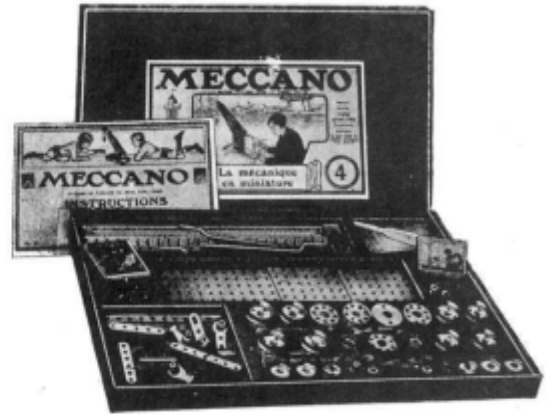
BOITE N° 4

L'âge du constructeur Meccano? Mais de 5 à 70 ans. Le plus jeune enfant peut commencer à construire des modèles dès qu'il a une boîte. Les seuls outils nécessaires sont un tournevis et une clef à écrous et ils sont contenus dans chaque boîte. Tout y est au complet, il n'y a rien d'autre à acheter.