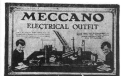
Prix Spécial : Frs 20