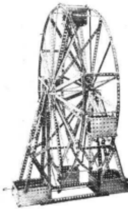
LA GRANDE ROUE

V ous pouvez construire avec Meccano ces merveilleux modèles, car chaque pièce de ce système correspond à une vraie pièce de mécanique. Vous avez des poulies, roues dentées, bandes, cornières, tringles, accouplements et manivelles : ce sont tous des pièces de précision. Chacune est standardisée et interchangeable.