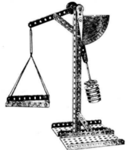
Modèle 343. Balance

Un autre genre de balances (Modèle 343) peut se faire également à l'aide d'un outillage N° 3, c'est un modèle intéressant ne serait-ce qu'à cause de son principe entièrement différent du pèse-lettre. La balance est très simple à construire, le contre-poids est fait de roues à boudin qui sont vissées à une tringle de 16 cm. (N° 15).