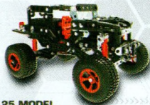
25 MODEL OFF-ROAD RACER 25 MODÈLES VÉHICULES TOUT-TERRAIN 17204