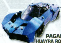
PAGANI® HUAYRA ROADSTER™ 17304