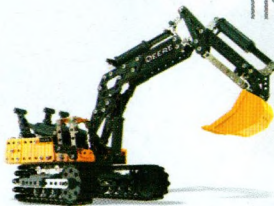
JOHN DEERE® 380G EXCAVATOR™ 17308