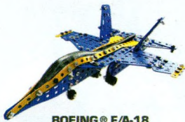
BOEING® F/A-18 SUPER HORNET™ 17303