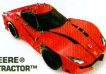
FERRARI® F12tdf™ 17305