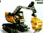
2 MODEL EXCAVATOR 2 MODÈLES PELLETEUSES 16301

SOLD SEPARATELY / VENDUS SÉPARÉMENT / SE VENDEN POR SEPARADO / SEPARAT ERHÄLTLICH / AFZONDERLIJK VERKOCHT / VENDUTI SEPARATAMENTE VENDIDOS SEPARADAMENTE / ПРОДУКТЫ ОТДЕЛЬНО / SPRZEDAWANE ODDZIELNIE / PROĐAVÁ SE SAMOSTATNĚ / PREDÁVA SA SAMOSTATNE / KÜLÖN KAPHATÓ / SE VÁND SEPARAT