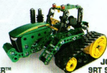
JOHN DEERE® 9RT SERIES TRACTOR™ 17306