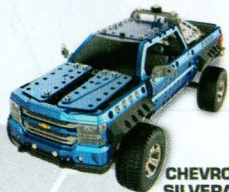
CHEVROLET® SILVERADO™ 17307