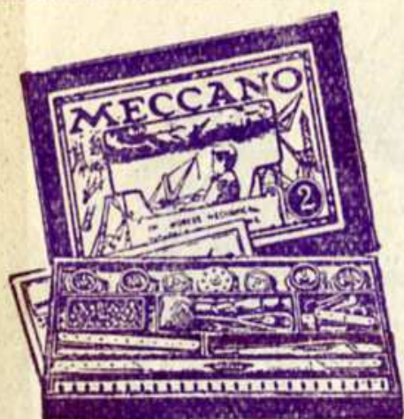
Boîte N° 2