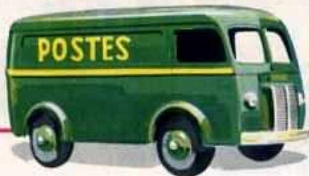
25 BV FOURGON POSTAL PEUGEOT Longueur 90 mm.