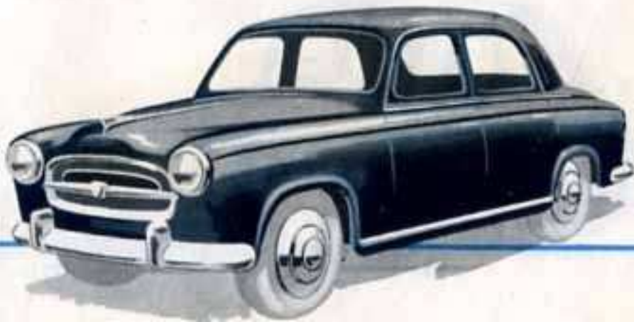
NOUVEAUTÉ 1956 24 B - 403 PEUGEOT Longueur 104 mm. Disponible en Juin 1956