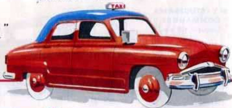
24 UT TAXI " ARONDE " Longueur 95 mm.