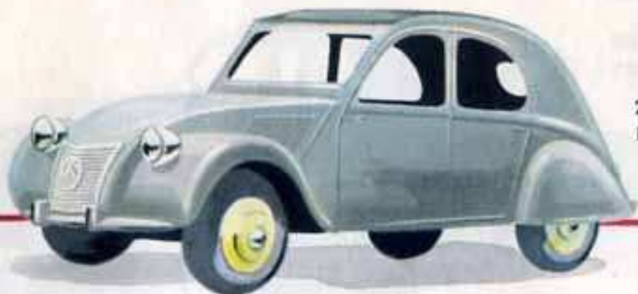
24 T 2 CV CITROËN Longueur 88 mm.