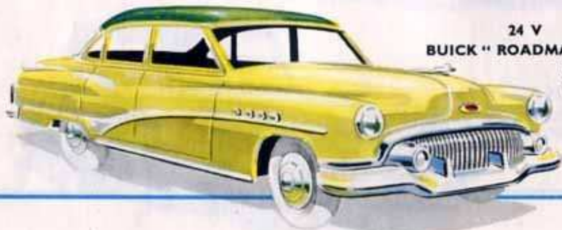
24 V BUICK “ ROADMASTER ” Longueur 112 mm.