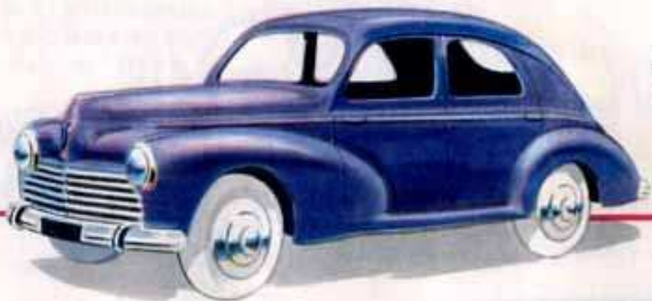
24 R 203 PEUGEOT Long. 100 mm.