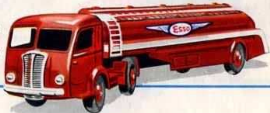
32 C - TRACTEUR PANHARD avec semi-remorque citerne ESSO Long. totale 178 mm.