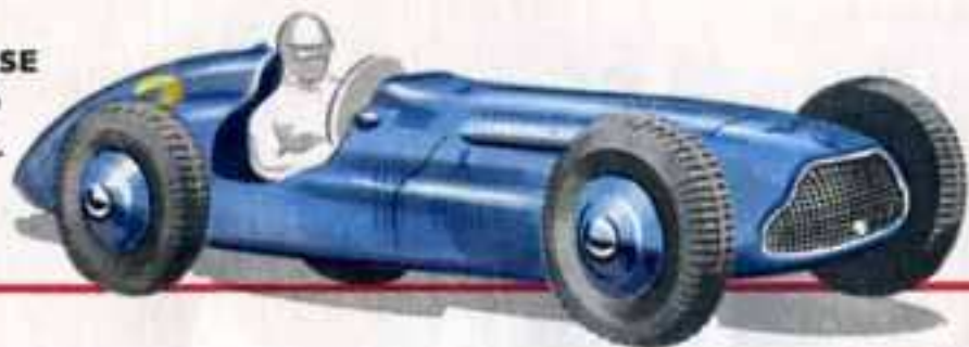
23 H AUTO DE COURSE TALBOT-LAGO Longueur 83 mm.