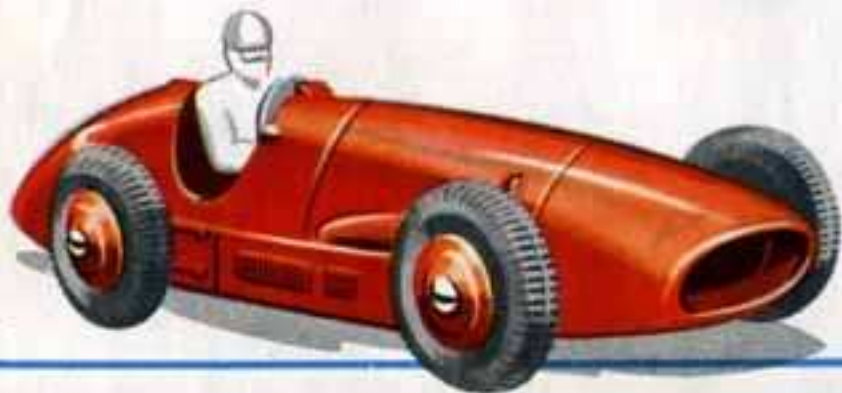
NOUVEAUTÉ 1956 23 J AUTO DE COURSE FERRARI Longueur 102 mm. Disponible en juillet 1956