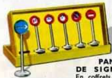
40 SIGNALISATION VILLE