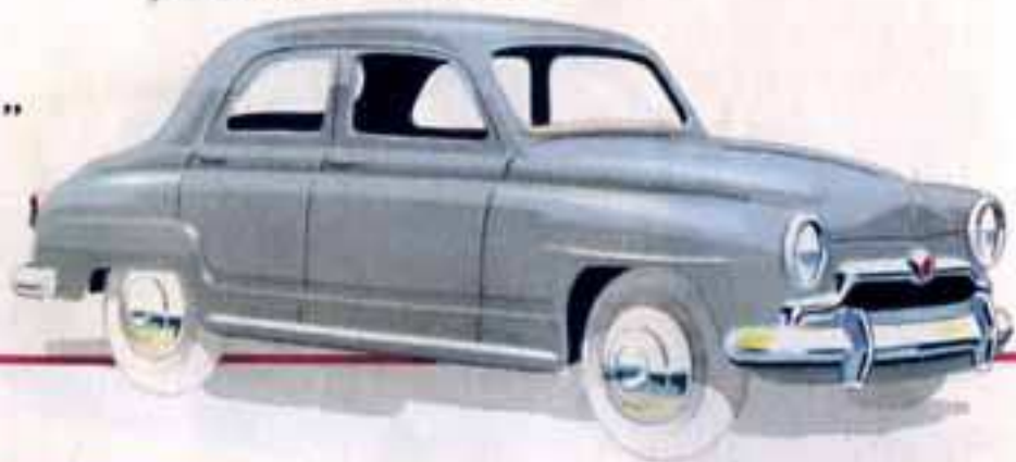
24 U SIMCA “ ARONDE ” Longueur 95 mm.