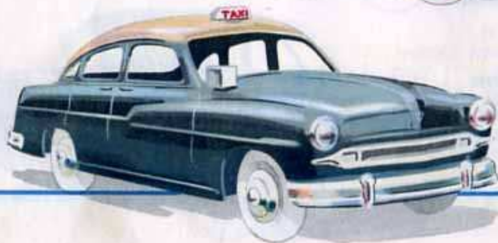
24 XT - TAXI " VELETTE " Long. 105 mm.