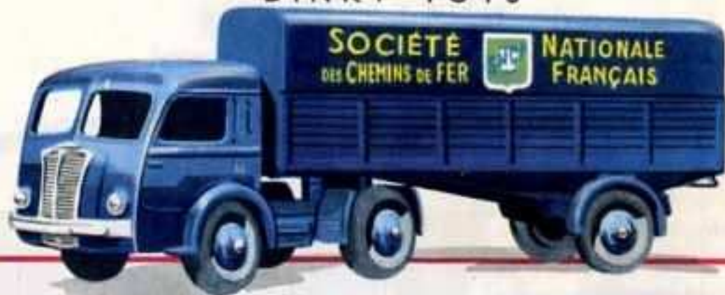
32 AB - TRACTEUR PANHARD avec semi-remorque S. N. C. F. Longueur totale 165 mm.