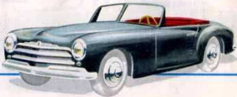
24 S SIMCA 8 SPORT Longueur 95 mm.